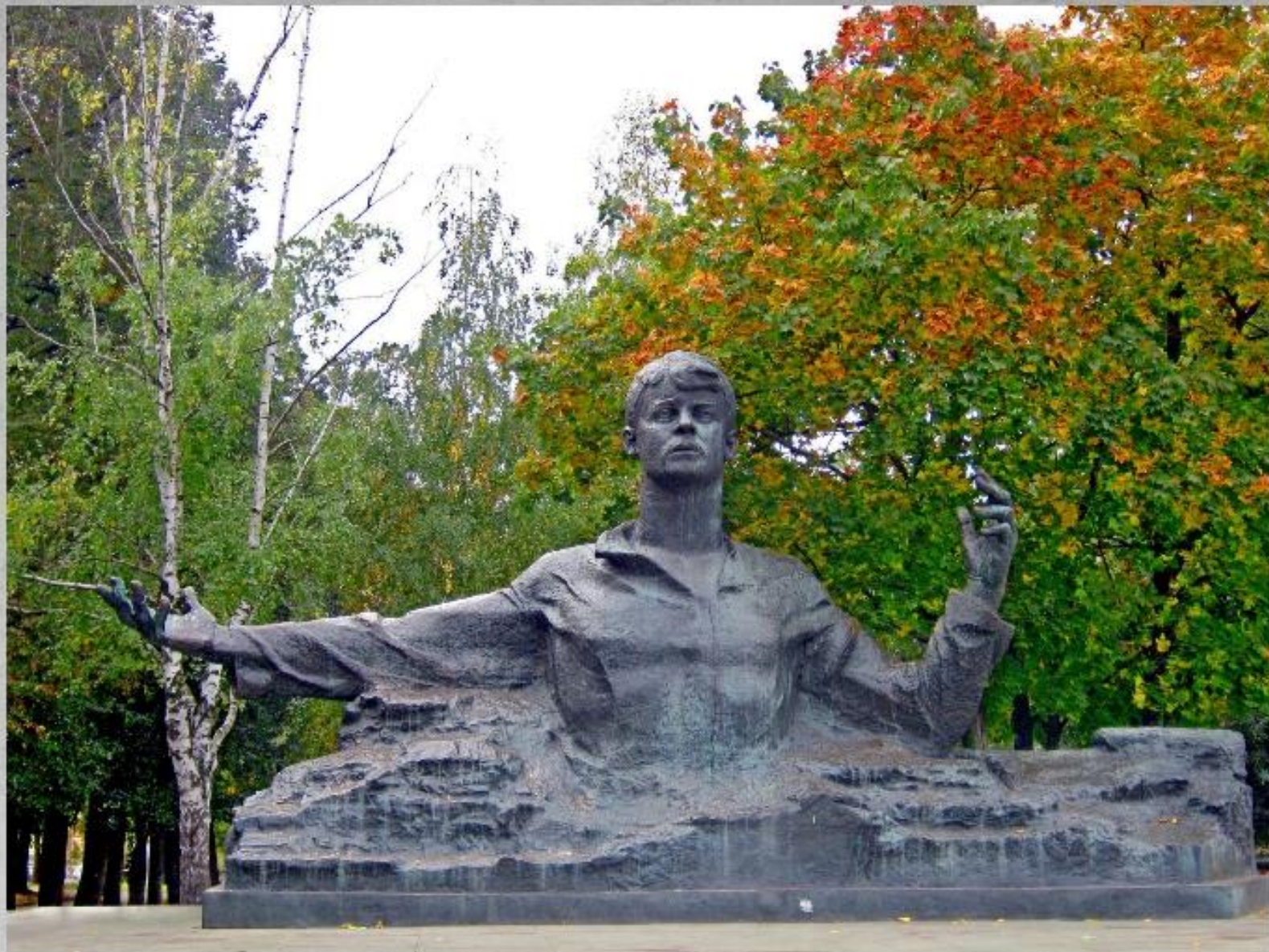
Памятник Сергею Есенину в Рязани