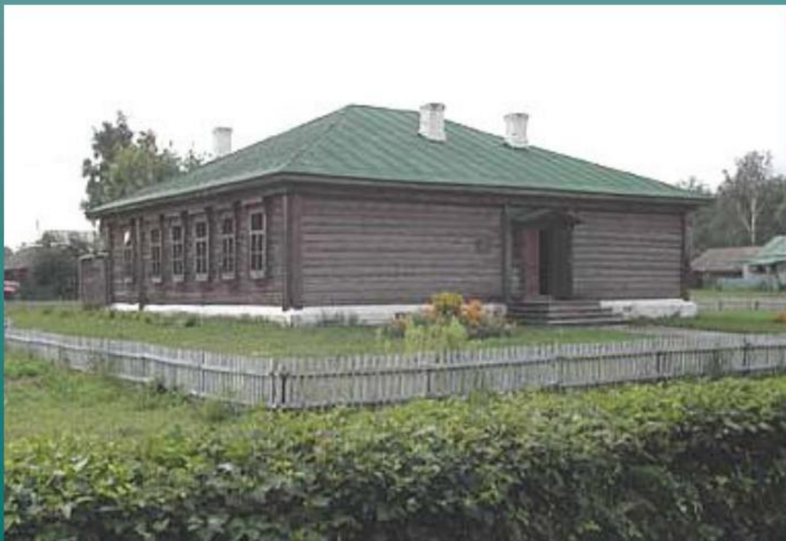
Школа, в которой учился Есенин