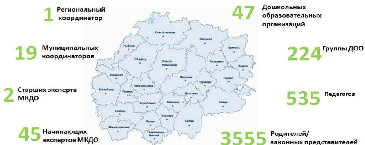
Рис.2 Участники МКДО-2022 Рязанской области

В регионе сложилось довольно большое экспертное сообщество, члены которого провели 1-2 экспертизы с применением инструментария МКДО. Выделение трех групп экспертов при проведении мониторинга прошлого года определило первоочередную задачу для региона по формированию пула экспертов, имеющих статус «Старший» и как перспективу «Ведущий».