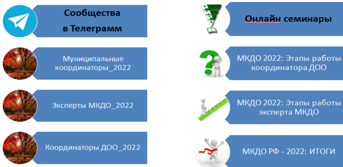
Рис.3 Региональное методическое сопровождение

В регионе проводятся семинары/вебинары с применением дистанционных технологий, нацеленные на распространение опыта координаторов ДОО и экспертов МКДО, полученного в ходе участия в мониторинговых исследованиях прошлых лет (Рис.3).