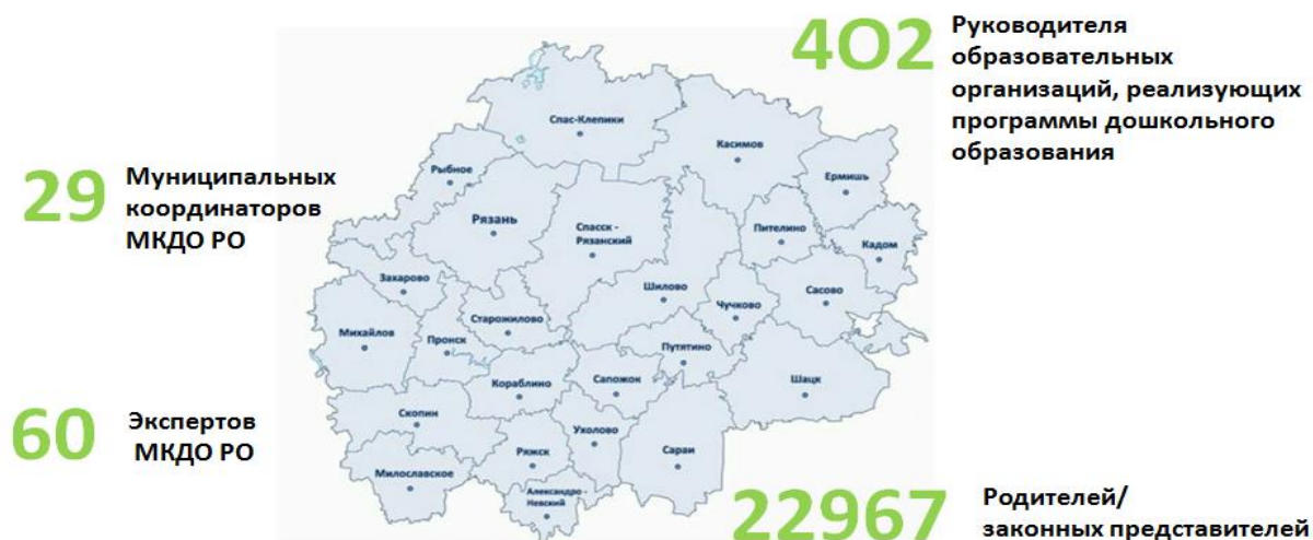
Рис.4. Участники регионального мониторинга оценки качества дошкольного образования в 2022 году

В региональном мониторинге оценки качества дошкольного образования принимают участие все образовательные организации, реализующие программы дошкольного образования. В 2022 году участие в региональном мониторинге оценки качества дошкольного образования приняло 402 ДОО из 29 муниципальных образований региона (Рис.5).