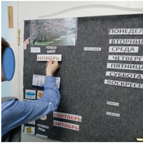
Рисунок 1. Работа с календарем