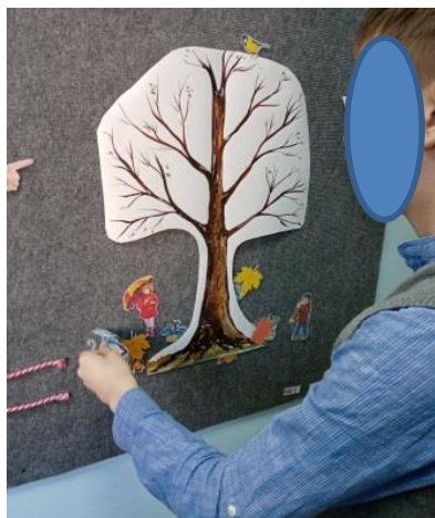
Рисунок 6. Работа по пространственной ориентировке