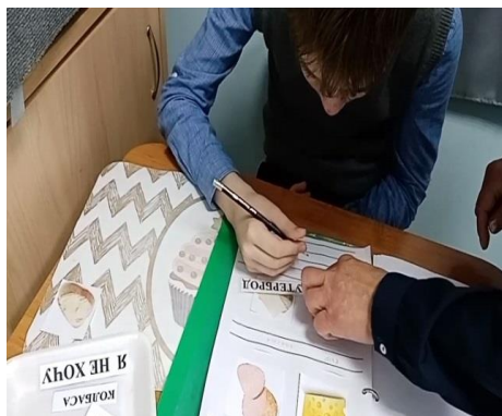
Рисунок 8. Работа в тетради