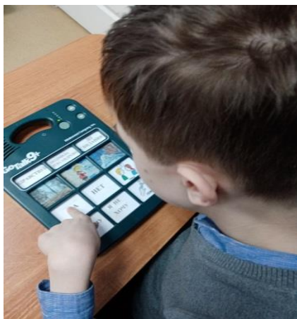
Рисунок 4. Работа с аппаратом Go Talk