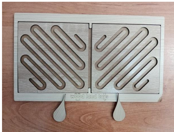
Рисунок 7. Посobie для формирования межполушарного взаимодействия