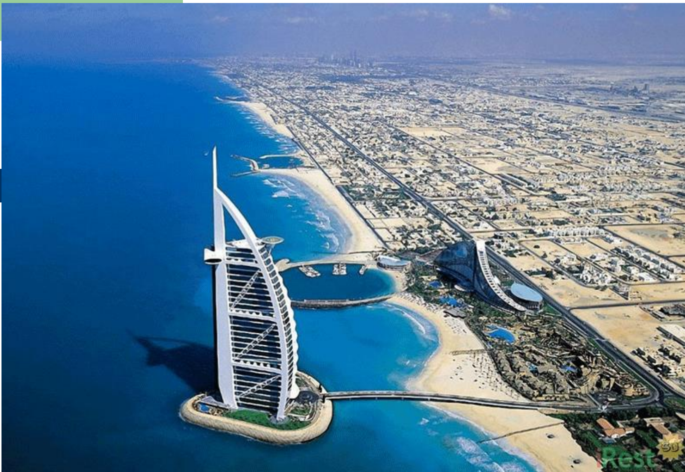
Бурдж Аль Араб (Дубаи, отель «Парус»),