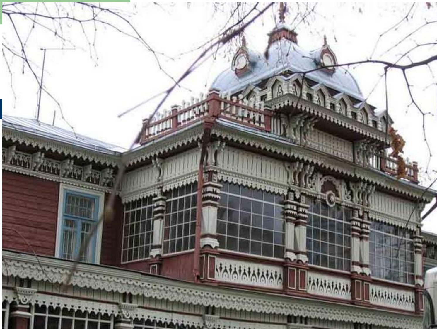
бывшая летняя резиденция Дворянского Собрания (горпарк, Рязань), сейчас научно-методический Центр народного творчества.