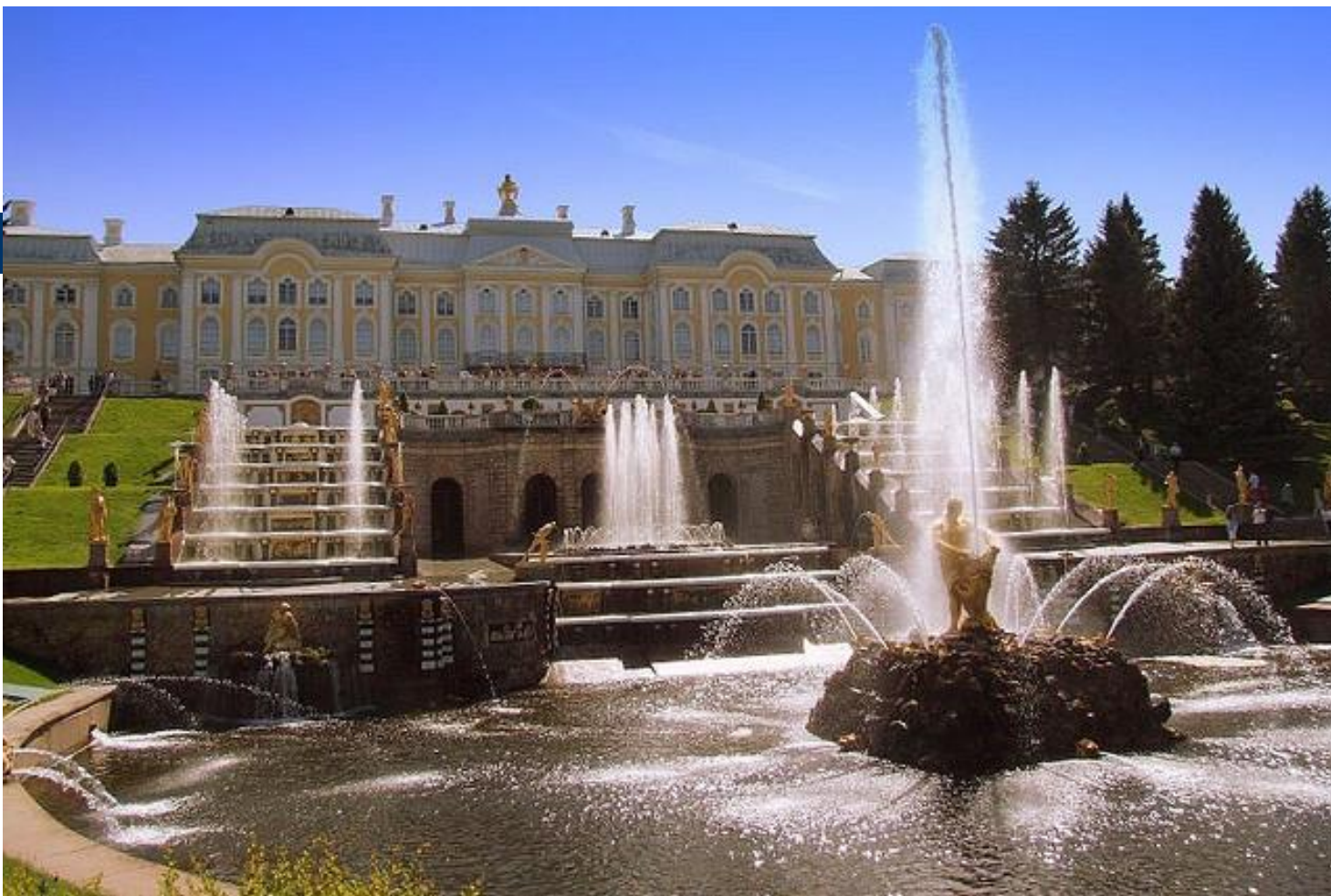
дворцово-парковый ансамбль Петергоф