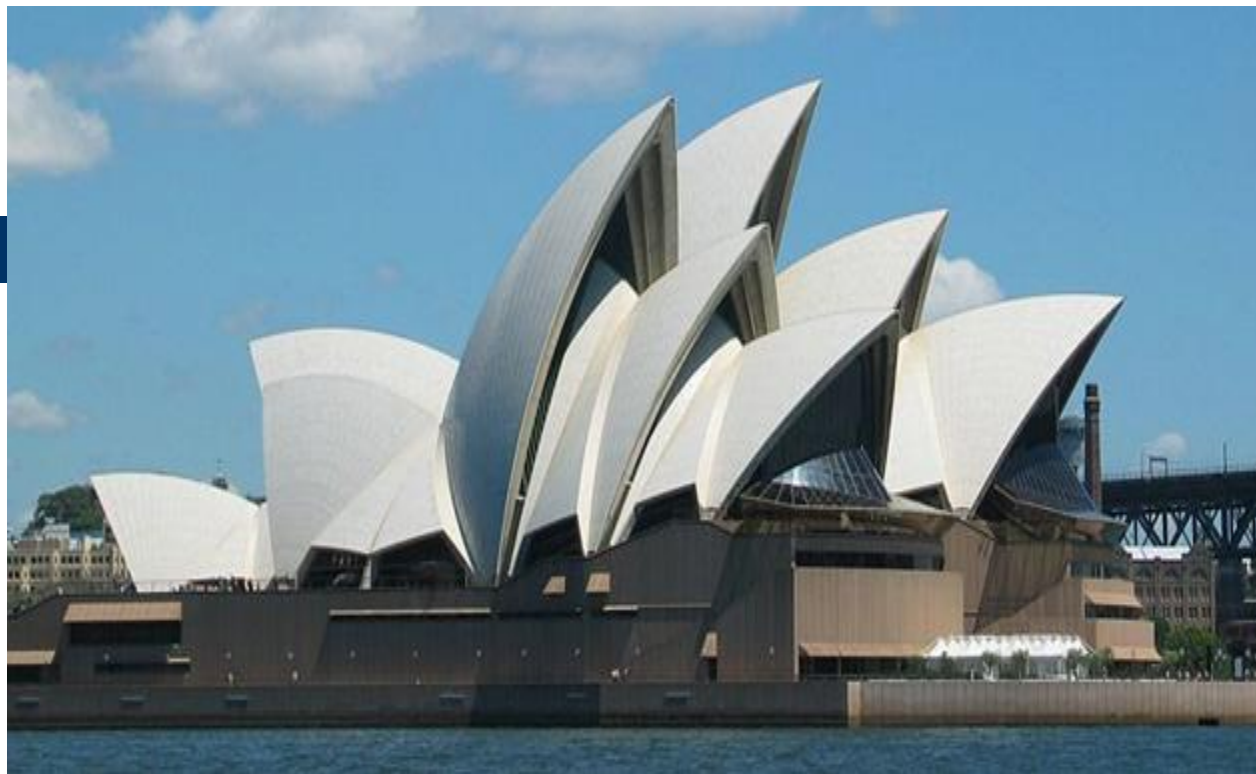
Здание сиднейской оперы