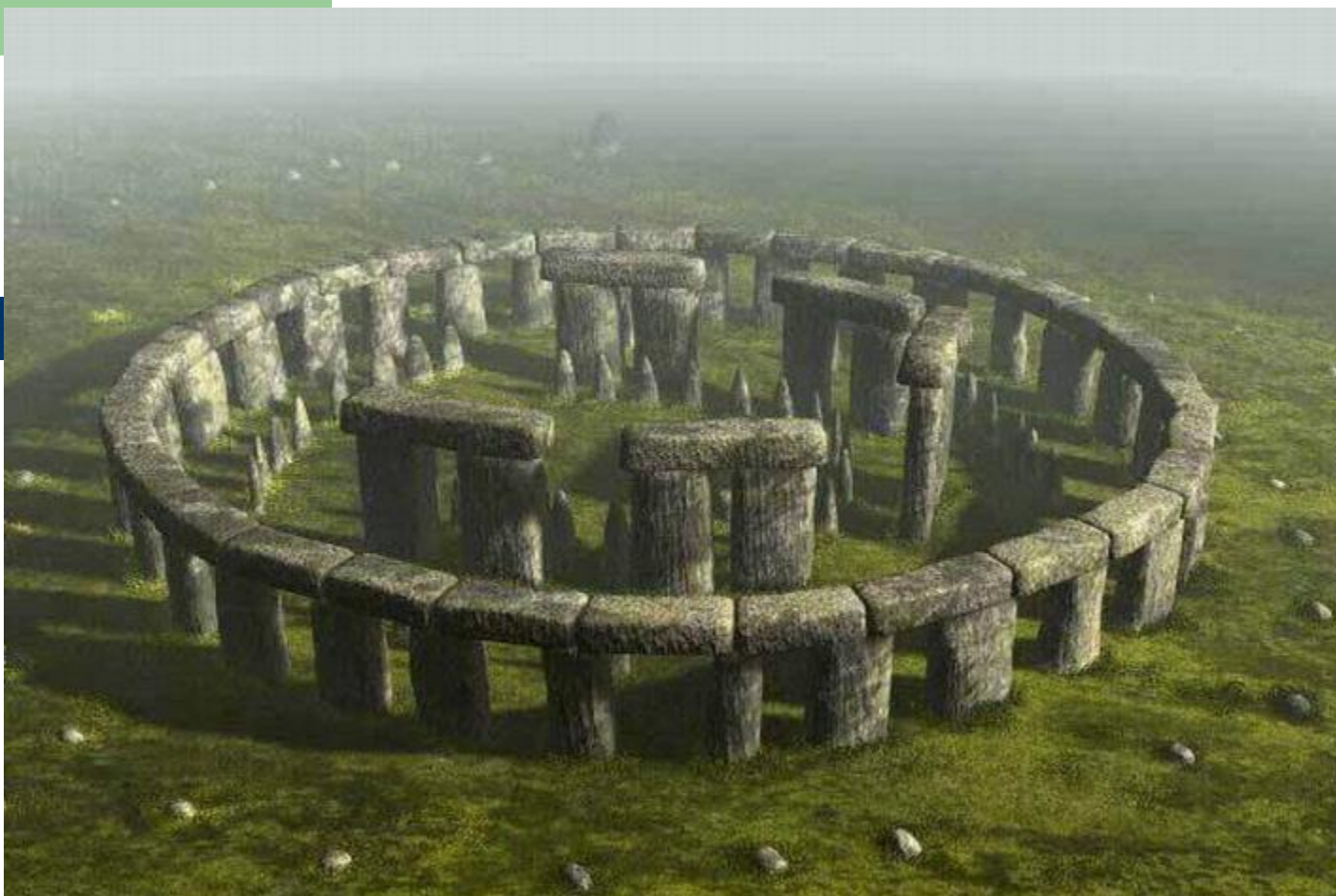
Стоунхендж в Англии